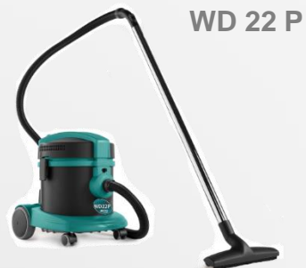
WD 22 P