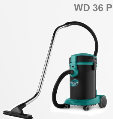
WD 36 P