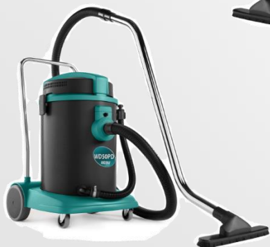
WD 50 PD