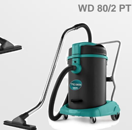
WD 80/2 PT

Leistungsstarke Modelle für die Nass- und Trockenanwendungen für den professionellen Einsatz mit Kunststoffbehälter in unterschiedlichen Ausführungen.