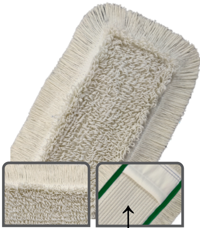
Spezielles Deckblatt 50/50