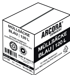
Karton: 200 Stück